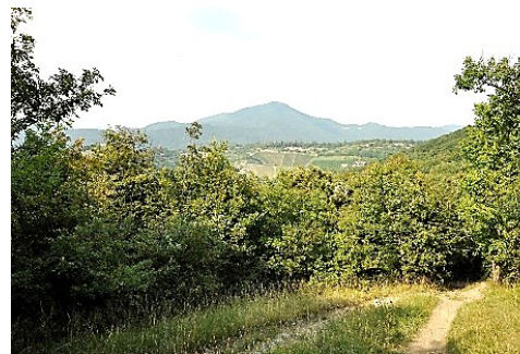
Panorama dal Colle

Su strade asfaltate si ritorna al parcheggio.