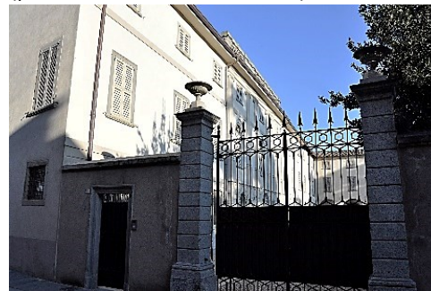
Villa neoclassica Simoni-Salvi-Gallizioli

Ritornati sui nostri passi ci dirigeremo in via Roma: ad accoglierci la bella Villa neoclassica Simoni-Salvi-Gallizioli con ampio Parco (peccato che non sia visitabile).