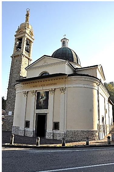
Il santuario della Madonne delle Rose

cappella fatta costruire dai viaggiatori nell'attuale struttura a ricordo dell'apparizione e come ringraziamento alla Madonna per aver risparmiato la popolazione dall'epidemia di Colera.