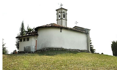
La Chiesa di San Giorgio