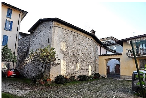
Strutture dell'antica fortificazione

campanile e scoperchiò il tetto e fu poi recuperata negli anni '30 del secolo scorso. Il panorama, se il tempo ci assisterà, giustificano lo sforzo. Una scalinata di 130 scalini ci riporta alla base del Colle. L'arrivo è nella zona umida nella conca della Valle di Albano. In cima il Palazzo Frizzoni e nascoste le chiese di San Cristoforo e di Santa Maria in Argon.