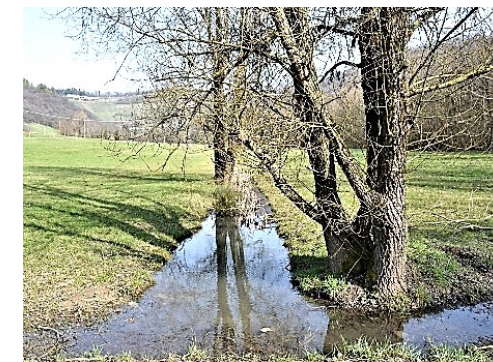
La Zona Umida alla base del Colle