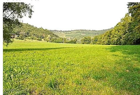
La Valle di Albano