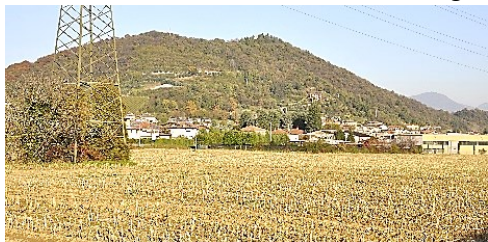
Il Colle di San Giorgio

Proponiamo un altro itinerario nel Plis delle Valli d'Argon: dal Santuario della Madonna delle Rose di Albano Sant'Alessandro alla Chiesa di San Giorgio.