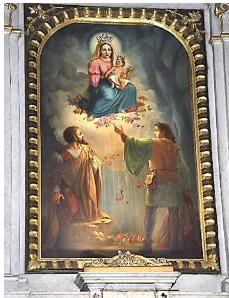
L'Apparizione del 1417 in una opera pittorica

Ritornati sui nostri passi ci dirigeremo in via Roma: ad accoglierci la bella Villa neoclassica Simoni-Salvi-Gallizioli con ampio Parco (peccato che non sia visitabile).