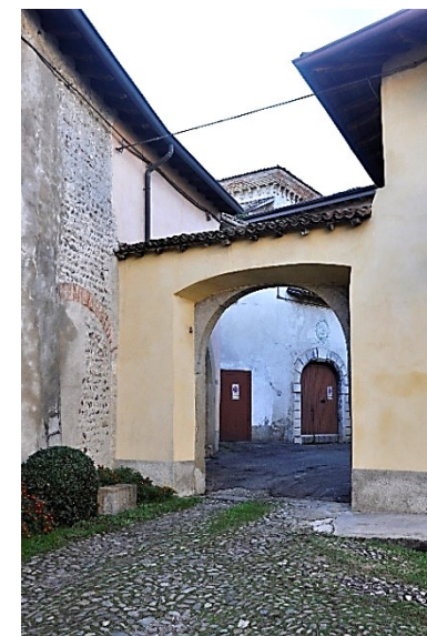
Corti interne delle strutture castellane