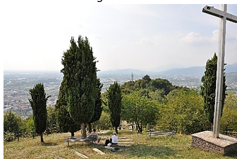
Panorama dal Colle di San Giorgio