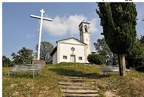
Chiesa di San Giorgio

Ci dirigeremo verso levante attraversando il torrente Zerra (o Roggia Borgogna di colleonesca memoria). Ha inizio la salita, prima su strada asfaltata e poi sentiero. La salita presenta alcuni tratti impegnativi (terreno argilloso). La chiesetta di San Giorgio del XII sec. fu ricostruita nel 1580; nel 1873 un violento temporale fece crollare il