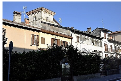
La Torre incastonata tra strutture cinquecentesche

L'emergenza successiva è il blocco di costruzioni che integrano quello che rimane dell'antico castello; svetta la Torre ora passerera . La parrocchiale, dedicata ai Santi Cornelio e Cipriano, fu terminata nel 1809, ma i documenti la ricordano dal XII sec. All'interno alcune opere. Purtroppo le devastazioni degli scontri fra le fazioni dei Guelfi e Ghibellini prima e la scomparsa degli edifici rurali poi ha trasformato l'antica Albo nella "nuova Albano".