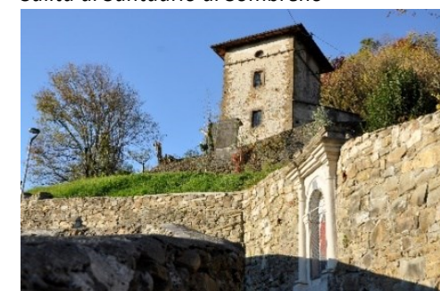
Torre Lazzaretto di epoca veneta