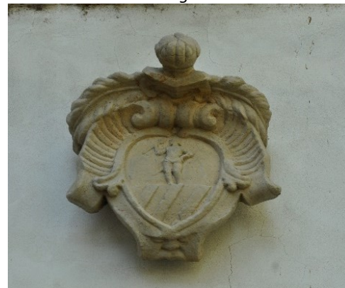
Stemma nobile in via Patrioti di Ossanesga