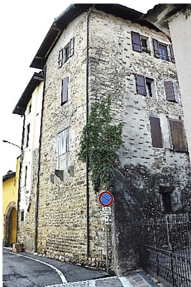
Casa torre di via Scuole Vecchie