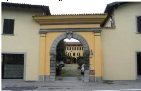
Villa Seminario a Scano

Dal parcheggio, lungo la via papa Giovanni, accompagnati dal torrente Quisa, si arriva all'antica Scano, in via Roma, dove si osserva un bel portale con stemma di villa Seminario, il primo di una lunga serie.