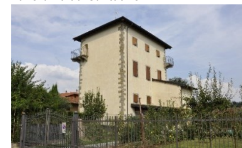
Torre veneta Vacis a Ossanesga

Schede: G. Nava (2024) e F. Gilardi (2019)