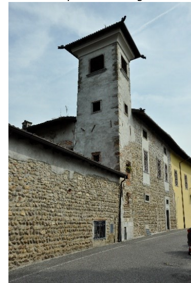
Torretta di palazzo Lupi a Ossanesga