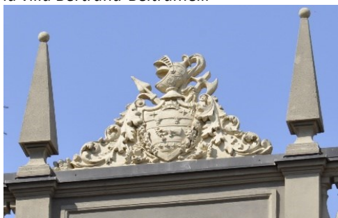
Emblema di villa Bertrand-Beltramelli

Altri 550 metri di nuove costruzioni per arrivare al nucleo storico di Paladina (archi, casatorre e altre strutture fortificate ma alquanto alterate). Nella piazza la parrocchiale di Sant'Alessandro; a sinistra la