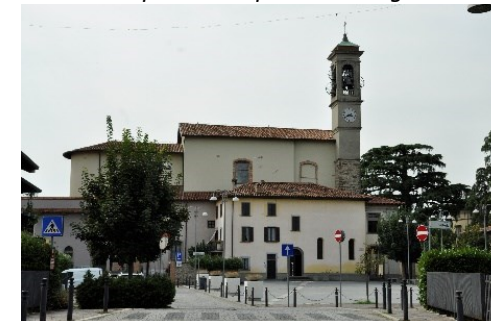
Piazza Vittoria di Ossanesga