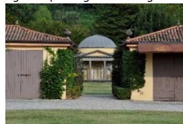
Tempietto neoclassico nel Parco di villa Agliardi