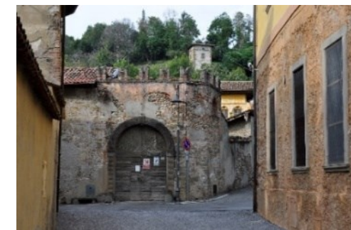
Salita al Santuario di Sombreno