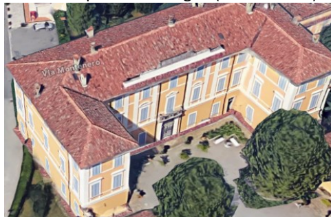
Villa Benaglio a Scano (immagine da Google Maps)

Più avanti a sinistra le strutture del castello di Scano con torre (nascosto), a destra altro portale con stemma di un grande edificio (Monastero), preceduto da un'alta cortina muraria. Altre strutture medievali si trovano in vicolo Chiuso (casa forte). Sempre in via Roma altri portali con stemmi, più avanti una prima piazza e poi una seconda con la parrocchiale dei Santi Cosma e Damiano (doc. dal IX sec. e rifacimento settecentesco), di fronte il palazzo Benaglio (Tacchi-Fenili).