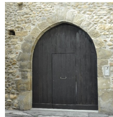
Portale in via Lupi di Ossanesga