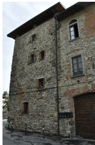
Cascina Castello Frera a Ossanesga

Seguono 650 m della nuova Valbrembo e siamo nell'antica Ossanesga. Via Patrioti presenta numerose presenze architettoniche: il castello di Ossanesga (Cascina Frera), una borgata con edifici storici con notevoli portali ed emblemi, la Villa Morandi-Lupi del XV sec., che si distingue per le curiose torrette. Ad accoglierci poi la bella piazza Vittoria con la parrocchiale dedicata ai Santi Vito, Modesto e Crescenza (ottocentesca); di fronte la villa Bertrand-Beltramelli, a sinistra, in via Scuole Vecchie, altra casa torre.