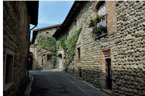
Via Patrioti di Ossanesga