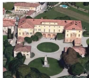
Villa Agliardi