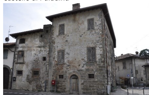
Castello di Sombreno