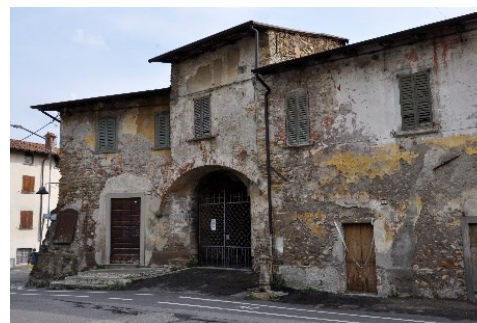
Castello di Paladina

sito: https://www.castrumcapelle.org Facebook: @castrum capelle contatti: castellodibergamo@gmail.com