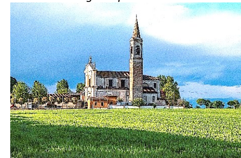
Chiesa di Santa Maria in Val Verde

Nel pomeriggio ci sposteremo autonomamente in auto a Orzinuovi, ritrovo alla porta Sant'Andrea (ampi parcheggi tra la via Giordano Bruno e via Marconi). Dopo la porta veneziana ci si apre la piazza con la Rocca di San Giorgio, ora sede per mostre. Una passeggiata nel paese lungo il percorso centrale ci conduce a Porta San Giorgio (sec. XV), con nuovi giardini e il Santuario dell'Addolorata. Lungo la via principale diversi palazzi, e la Parrocchiale di Santa Maria Assunta.