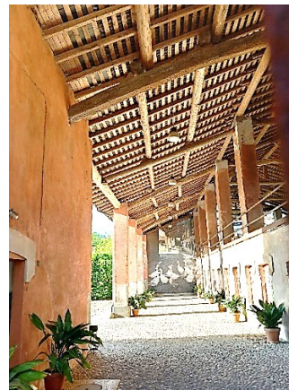
Edificio rurale a Padernello