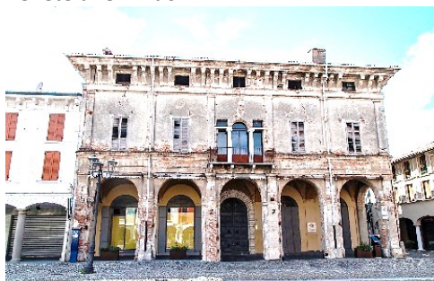
Palazzo in via Vittorio Emanuele (Orzinuovi)