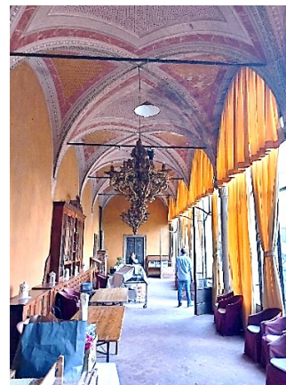
Interno del Castello di Padernello