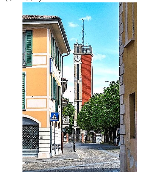
Torre littoria (Orzinuovi)

informazioni e coordinamento prima e durante l'uscita: 3389213848 - 3406987249