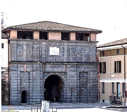
Porta di Sant'Andrea (Orzinuovi)