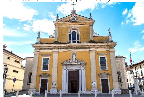
Facciata della Parrocchiale di Santa Maria Assunta (Orzinuovi)