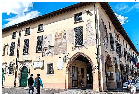
Palazzo Podestarile (Orzinuovi)