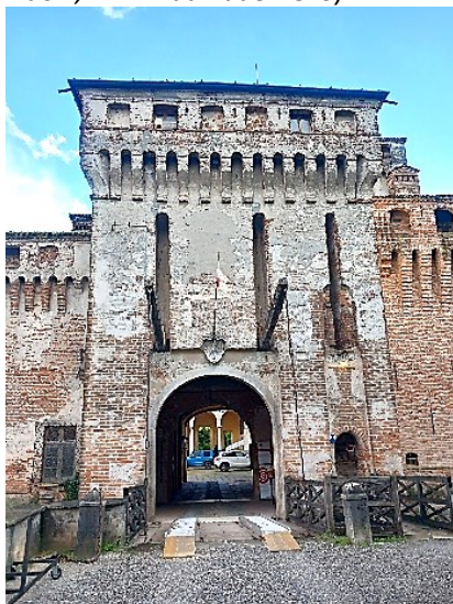
Ponte levatoio e rivellino del Castello di Padernello

Percorso di 5 Km circa, 1,5 ore di cammino più le lunghe soste, 55 km da Bergamo (spostamento in auto in autonomia a Orzinuovi, 12 Km da Padernello).