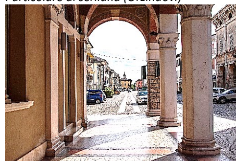
Via Vittorio Emanuele (Orzinuovi)