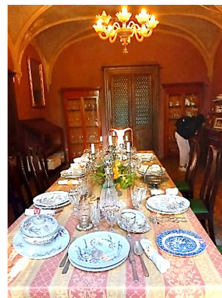
Interno del Castello di Padernello