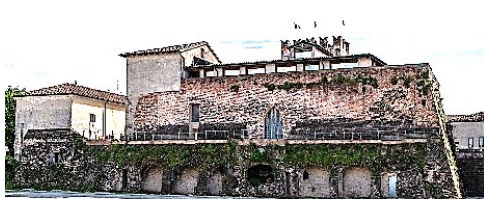
Rocca di San Giorgio (Orzinuovi)