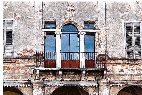
Particolare di serliana (Orzinuovi)