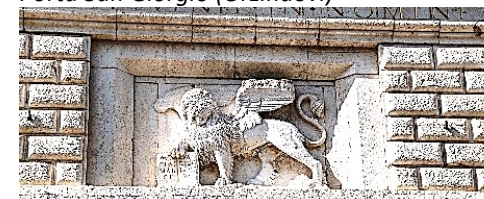
Particolare del leone di San Marco (Orzinuovi)