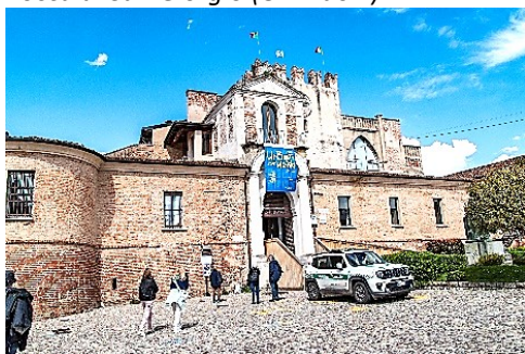
Rocca di San Giorgio (Orzinuovi)