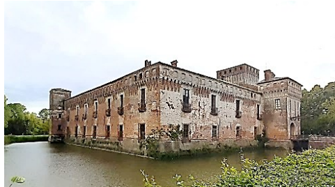
Il maniero di Padernello con il fossato