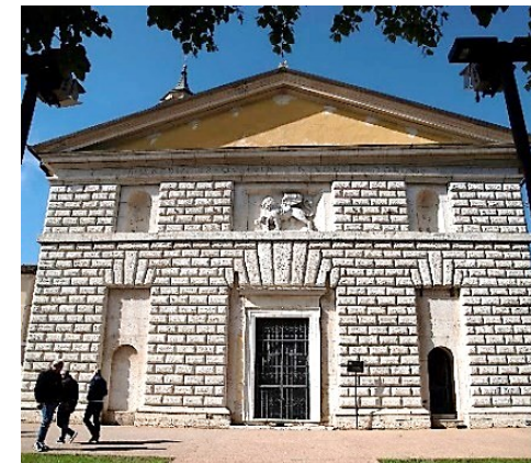
Porta San Giorgio (Orzinuovi)