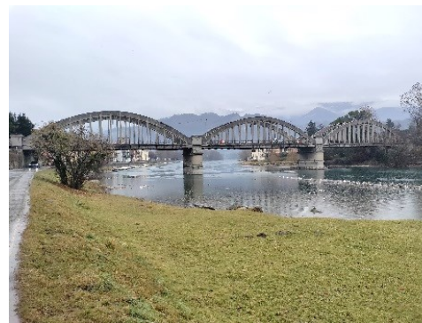
Il Ponte di Brivio

Forse un Ponte Romano, un altro del 1373 costruito dai Savoia, poi quello veneziano distrutto nel 1483 dai milanesi.