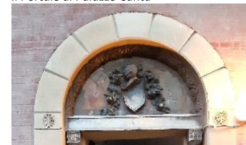
Portale con stemma nobile

[Scheda itinerario di Gianluigi Nava]