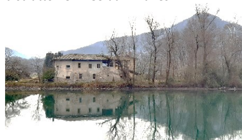
Casolare sulla sponda bergamasca

Forse un Ponte Romano, un altro del 1373 costruito dai Savoia, poi quello veneziano distrutto nel 1483 dai milanesi.