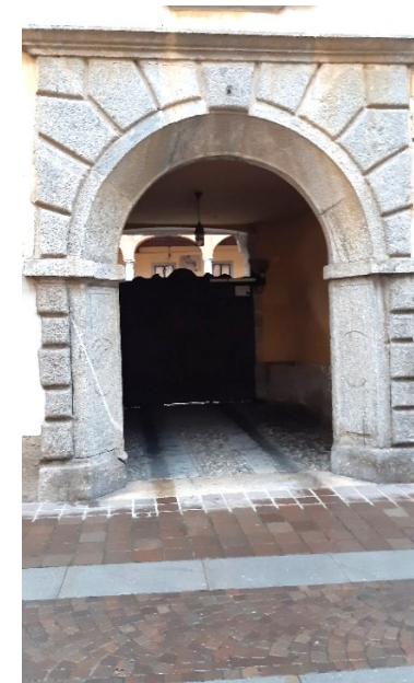
Il Portale di Palazzo Cantù