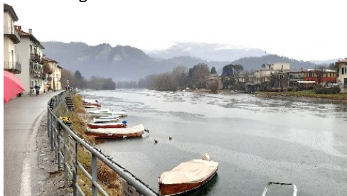
Brivio, lungo fiume verso nord

Brivio, nella valle San Martino e in provincia di Lecco, ha come segni particolari: il fiume Adda che, per la morfologia dei luoghi, ha creato un ambiente con isole e paludi (Isola della Torre e Isolone del Serraglio); il Ponte, protagonista di vicende storiche, (l'attuale risale 1917), il Castello, tra storia dei Visconti e della Repubblica Veneta; gli edifici religiosi, e la coreografia dei monti fa il resto.