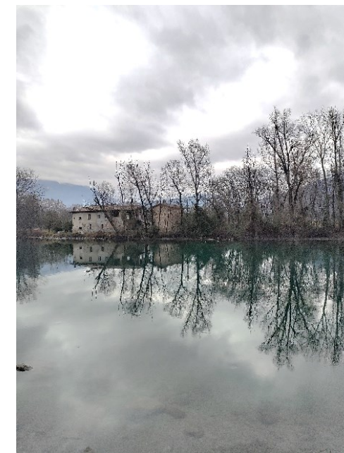
Paesaggio fluviale lungo l'Adda