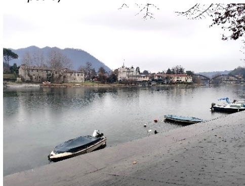
Brivio, lungo fiume verso sud