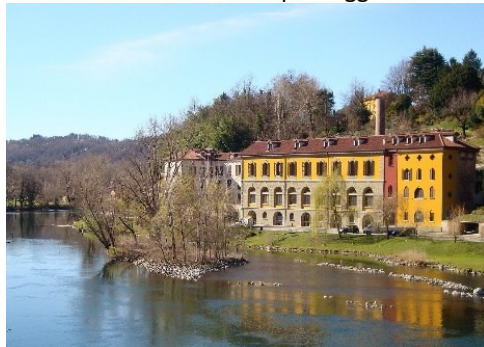
La filanda

un percorso all'aperto permettono di vedere alcuni Reperti. Documentato dal 960, Brivio si posiziona sulla sponda destra dell'Adda, su quella opposta la località bergamasca La Sosta dei Nobili Vimercati. La Chiesa Parrocchiale dei Santi Sisinio, Martirio e Alessandro ci ricorda l'antica Pieve di Brivio, insieme all'Oratorio di San Leonardo e alla Chiesetta di Sant'Antonio. La Passeggiata lungo l'Adda ci porta alla classicheggiante Filanda Carozzi del 1875 e alle località Toffo e Molinazzo: incantevole il paesaggio fluviale.