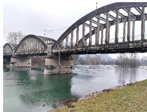
Il Ponte di Brivio