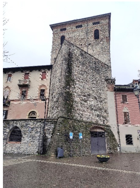
La Torre Mastio con il Baluardo triangolare