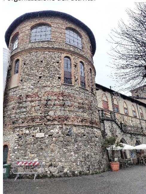
Il Torrione circolare del Castello