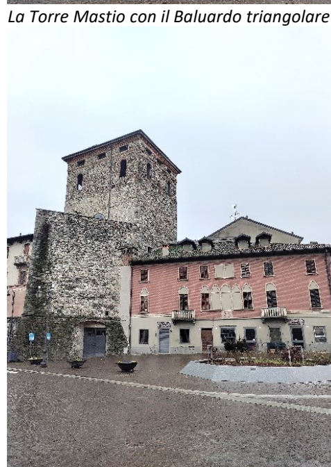
Piazza Carlo Frigerio