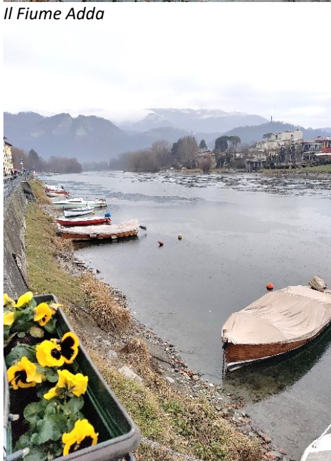
Il Fiume Adda