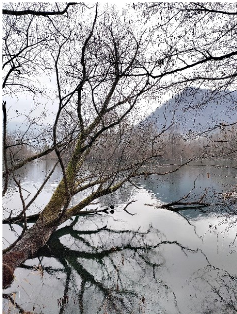
Il Fiume Adda